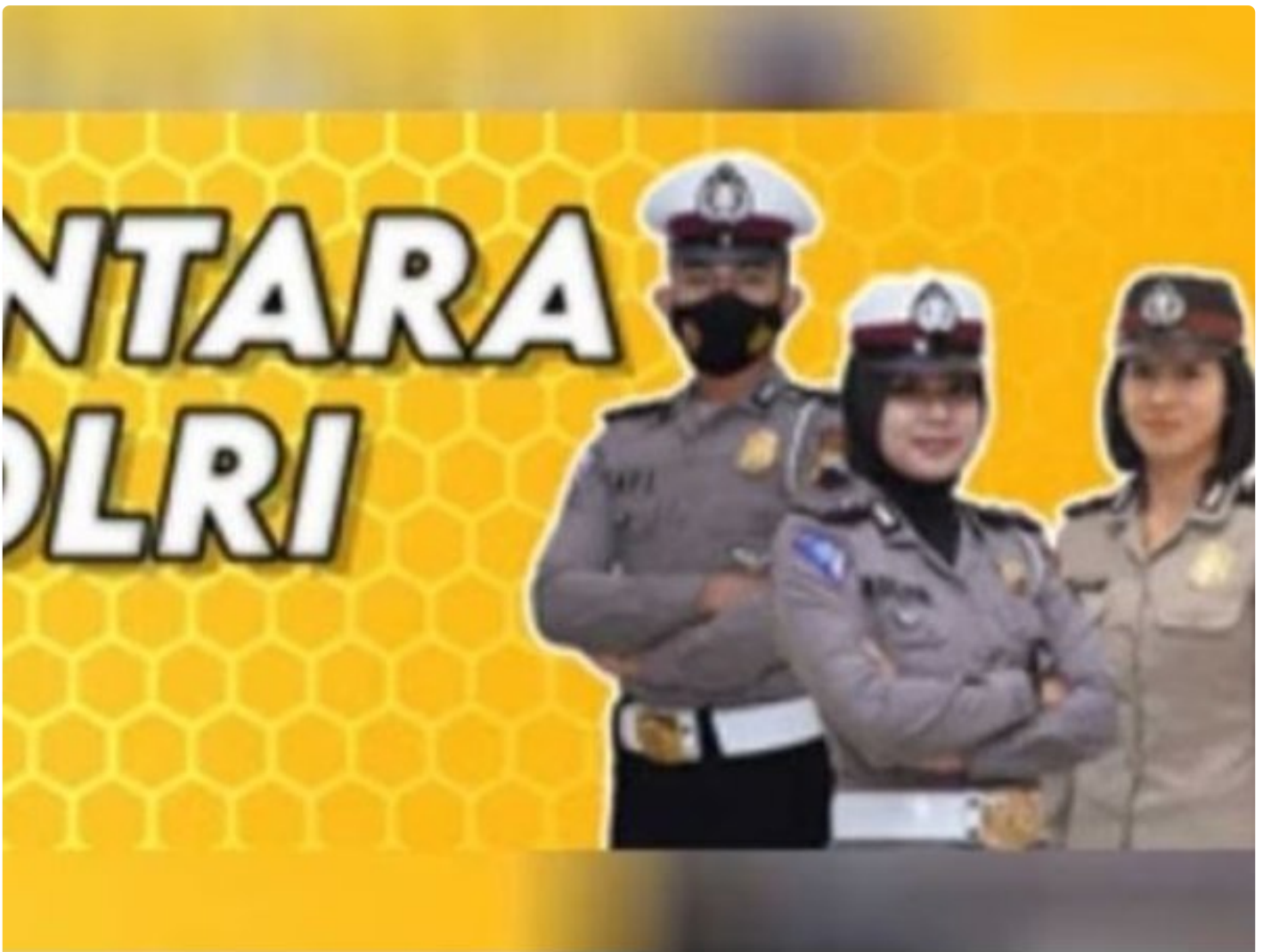
Penerimaan Polri Bakomsus

PALANGKA RAYA - Kesempatan terbuka bagi lulusan bidang pertanian, perikanan, peternakan, gizi, dan kesehatan masyarakat untuk bergabung menjadi anggota Polri melalui program penerimaan Bintara Kompetensi Khusus (Bakomsus).