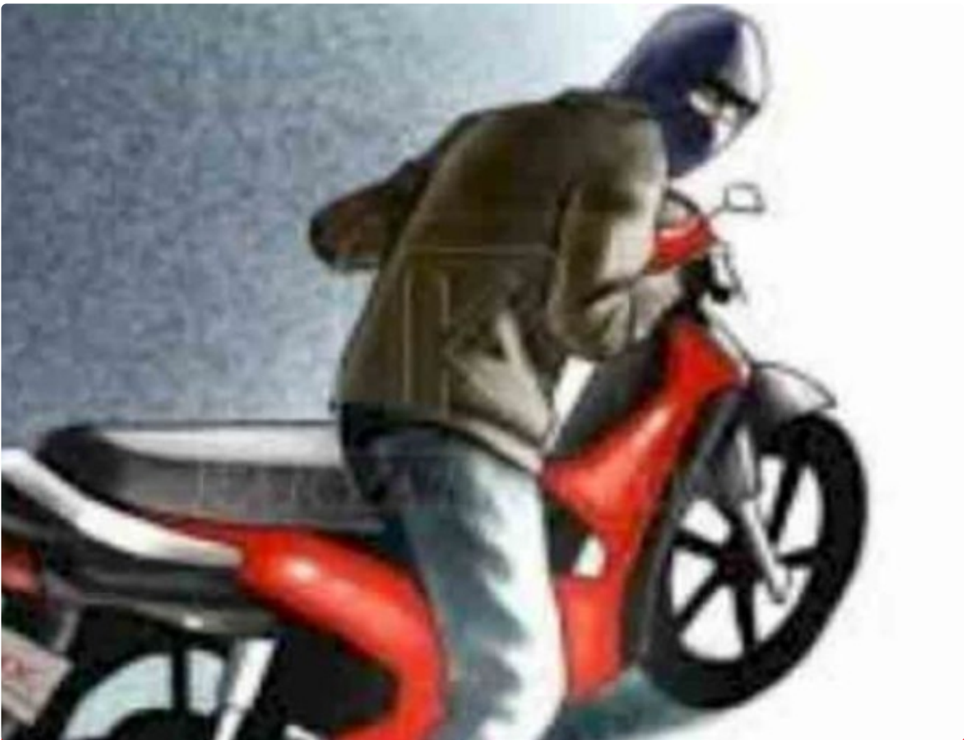
Gambar, Ilustrasi Depkoleptor Rampas Motor Konsumen Dengan Paksa

PALANGKA RAYA - Pemberitahuan bagi masyarakat Kalimantan Tengah, khususnya bagi memiliki sangkutan dipihak Pendanaan, terutama memiliki kredit Sepeda motor atau Mobil.